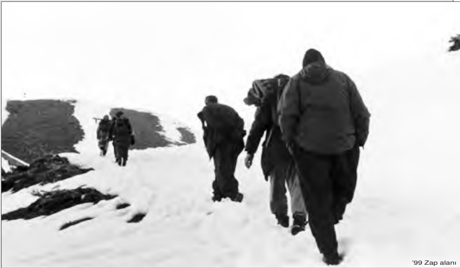
'99 Zap alanı

bir ayını andıran törenlerine başlarlar. Taç yaprakları hazırlanır, tedirgin bekleyiş yaygınlaşır ve iştme yetisi olan her şey toprağın iç uğultusuna, rüzgarın ufuk biçimleri ile çarpışmasına ve yukarılardaki öfkeli ve sevinçli birleşme hazırlığına kulak kabartır. Doruklardaki bu şiddetli gerçekleşme, onu dinleyen herkesin ve her şeyin kendini görebildiği, kendisine ilişkin bir başlangıçtır. Her şey ve deniz ve dağın doruktaki