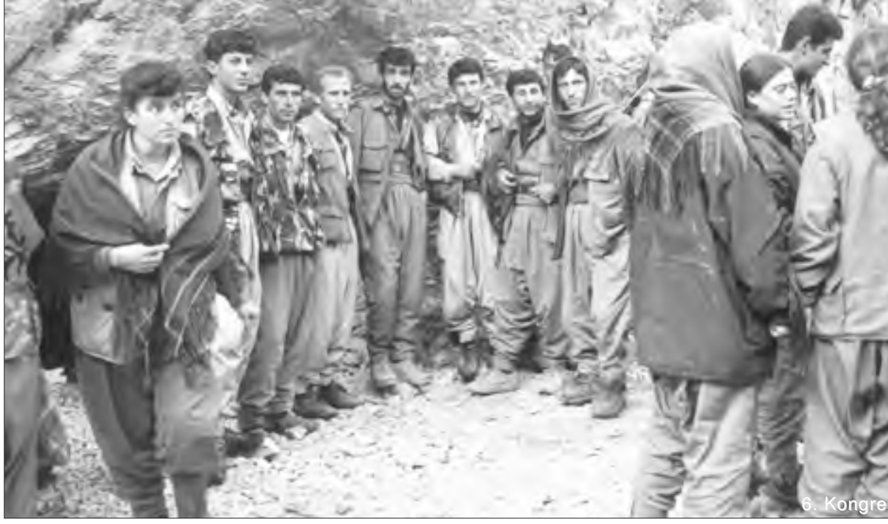
“Artık Apocu felsefe, Apocu çizgi Kürdistan halkı ve dünya devrimci gündeminde daha fazla yaşamsal bir olgu olacaktır. Yön veren, yürüten, yaşatan ve pratikleştiren etkili bir güç...”

sin hedefleyen operasyon biçimleridir. Ani ve hızlı geliyor. Buna karşı tedbirler etkili olmazsa, kayıpların verilmesi mümkün olabilir. Nitekim Amed gibi bazı eyaletlerimizde bu yaşanmıştır. Düşmanın hareket tarzını dikkate almayan bir biçimde hareket etmelerinden dolayı bazı kayıplar verildi. Onun bu taktik yaklaşımlarını boşa çıkaran, doğru