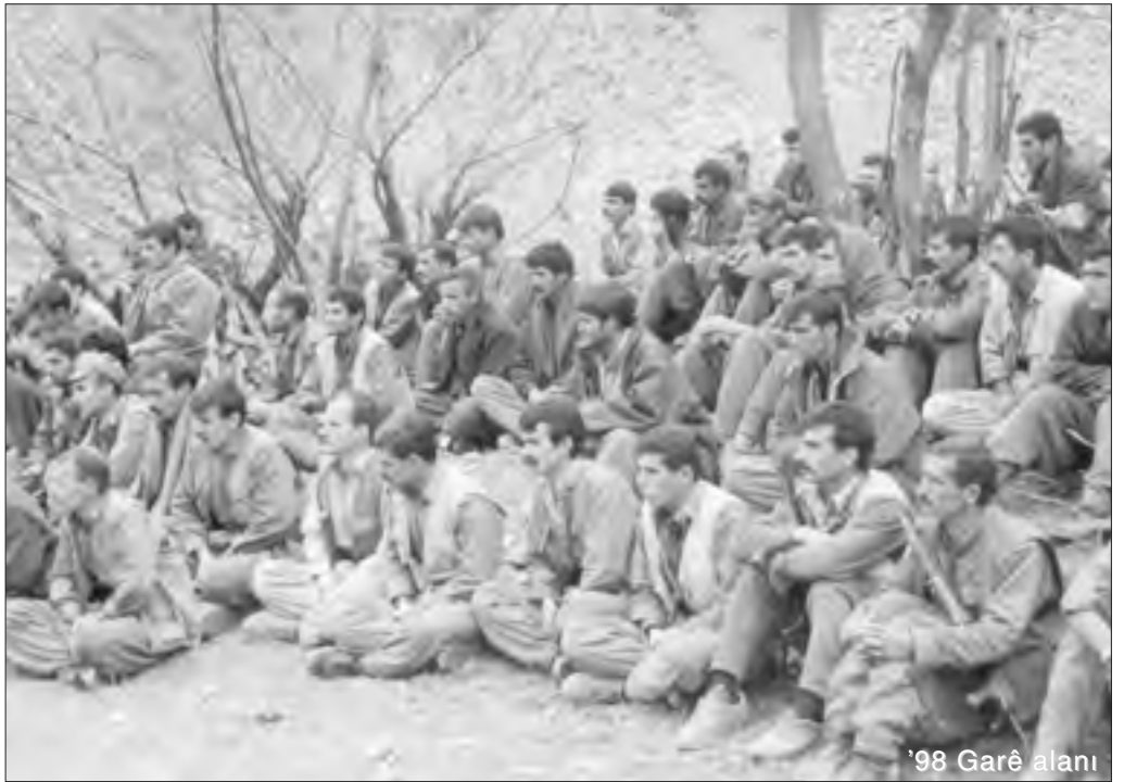
“İnsanı kendini yakacak kadar bazı temel değerlere bağlıyorum.”

Şaşkınsız, ayrıca sarhoşsunuz. İmkansızlıklardan değil, imkanlardan ötürü hastasınız. Sizi çözemiyorum, çözmekte zorlanıyorum. Bu el yordamıyla bile olsa oldukça ileri düzeyde başarılacak bir çalışmaydı. O dağlara böyle bir güç ulaştıktan sonra düşman böyle üzerine gelebilir miydi? Taktisyenler hesap versin, sizden hesap soruyorum. Askerlik nedir size göstereceğim. Basit