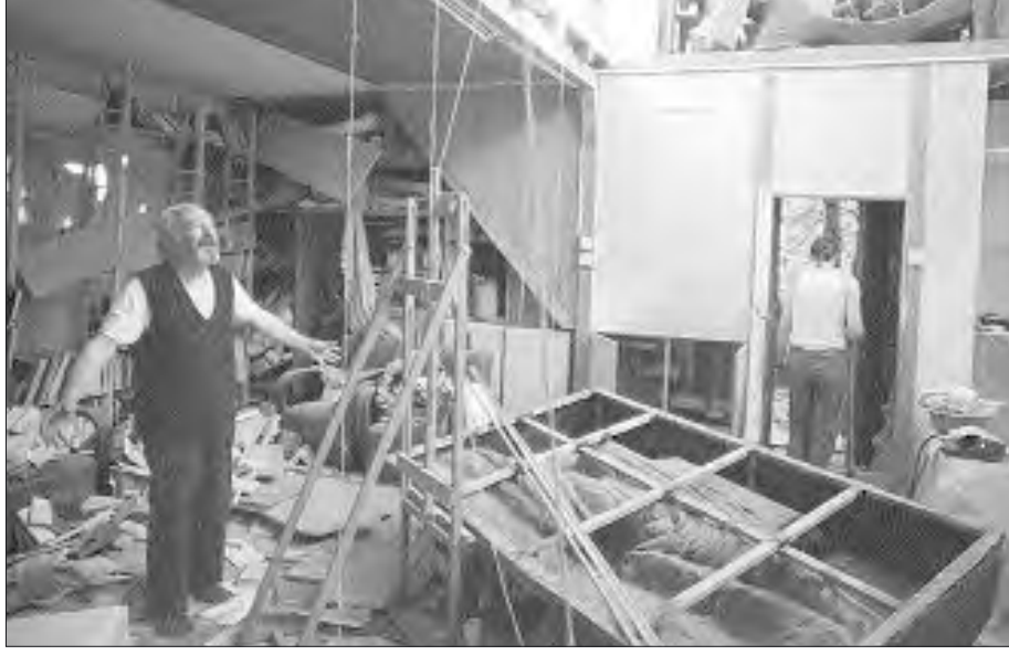
Yugoslavya'yı parçalama politikası özellikle Almanlar tarafından gündeme getirildi.

mak için önemli bazı bölgeler var. Dünya siyasetinde stratejik bir rol oynayan Ortadoğu, Balkanlar, Kafkasya, Avrupa gibi bölgeler emperyalizmin dünya siyasetinde stratejik öneme sahiptirler. Buralarda egemenlik kurulmadan, buralarda düzen oturulmadan, dünya çapında istikrar kazanmış, güvenilirlik –kendiyimleriyle– bir düzenin, sistemin kurulmasının pek mümkün olmadığını çok iyi biliyorlar. Dikkat edilirse