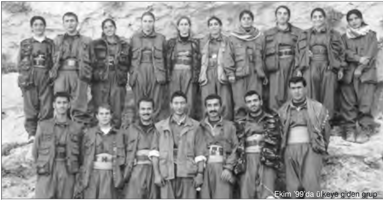
Ekim '99'da ülkeye giden grup

Tarihsel ekonomik-sosyal temelleri olan ordunun egemenliği, Türkiye'ye özgü bir durumdur. Yaşadığımız yıl itibarıyla de çetritli aşamalardan geçen bu askeri sistem; kendisini, tüm toplumsal yapıyı, Batı sistemiyle iyice bütünleşmiş, birleşmiş bir duruma getirmiştir. Nitekim 18 Nisan seçimleri, bunun siyasi yapılanmasının ortaya çıkmasıdır. Ordu tarafından yaratılan sistem, sivil ve siyasi alanı da artık tamamladı.